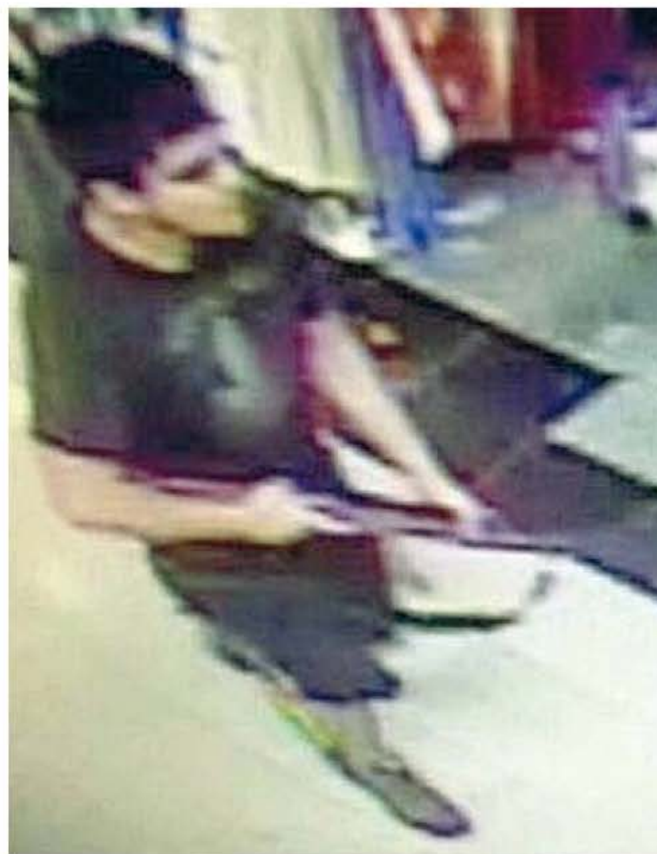
Con il fucile Le immagini delle telecamere di sicurezza del centro commerciale mostrano un giovane sulla ventina

Nella zona arrivano pattuglie, unità speciali, un elicottero, cani anti-bomba. Gli agenti conducono perquisizioni attente, cercano eventuali complici, mettono in sicurezza l'area. Scene già viste dozzine di volte. Passerà oltre un'ora prima che il complesso sia evacuato completamente. Il timore delle forze di sicurezza in queste situazioni è che lo sparatore possa tendere agguati ai soccorritori. I controlli si estendono poi progressivamente all'area circostante, seguendo le indicazioni di chi ha visto il sospetto fuggire. Ed ecco i posti di blocco, altri elicotteri, l'intervento dell'Fbi. Una grande caccia all'uomo sintetizzata dalla