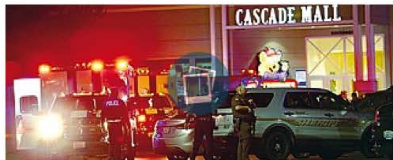
Polizia Gli agenti di fronte al Cascade Mall, il centro commerciale di Burlington, vicino a Seattle, sulla costa ovest degli Stati Uniti, dove si è verificata l'ennesima strage